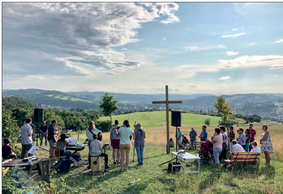
V neděli 21. července se konal druhý Večer chval nad městem u kříže na Šibenících na ulici Krňovské. Tentokrát byl inspirací citát „Všechno je stvořeno skrze něho a pro něho.“ (Kol 2, 16).