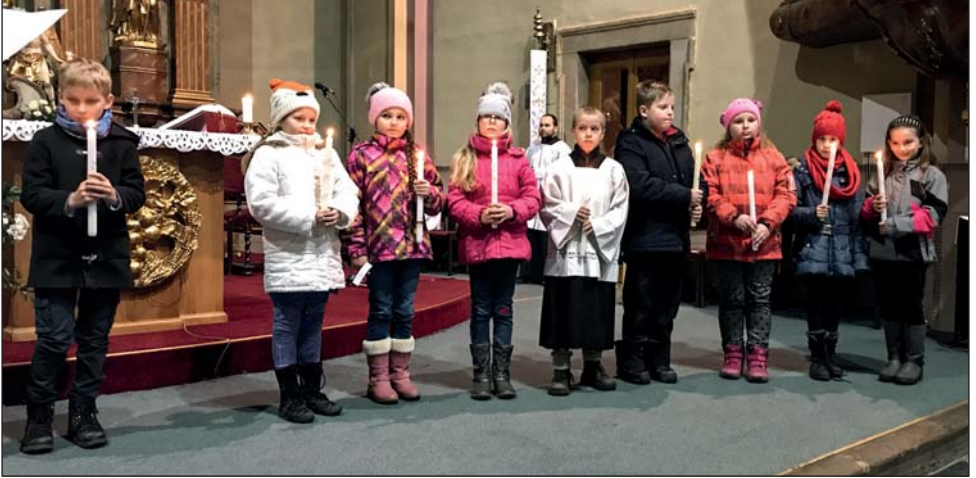
Představení dětí (celkem je jich 12), které letos půjdou k 1.sv. přijímání.