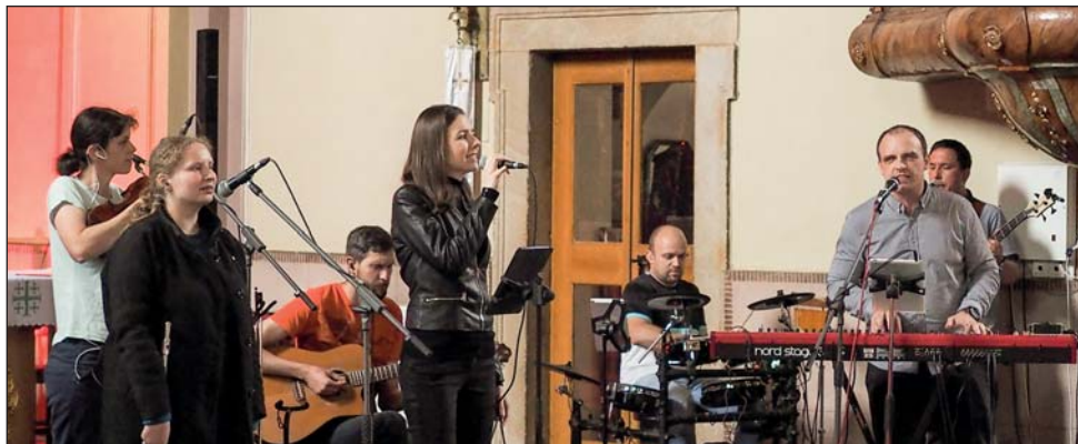
Květnový večer chval se společenstvím Zlínské chvály.