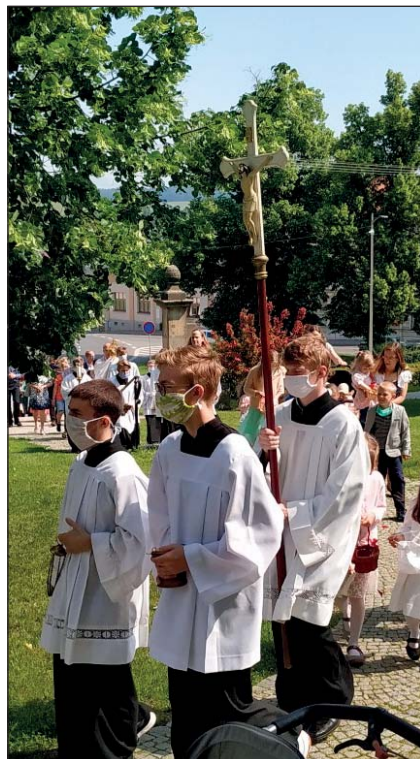
Oslava Božího těla v naší farnosti.