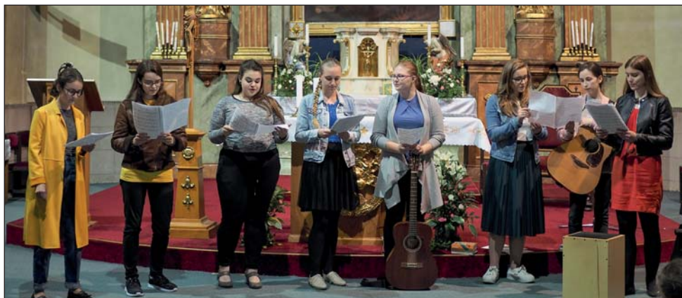
Noc kostelů 2020.