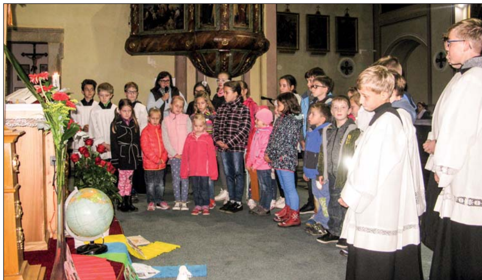
Mše sv. se zaměřením pro děti na téma Misie.